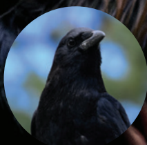
ODORAT MOINS DÉVELOPPÉ Corneille d'Amérique