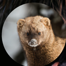
L'ANIMAL QUI SENT BON Pékan