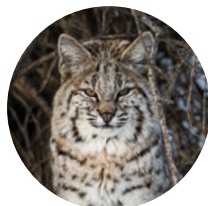
GOÛT MOINS DÉVELOPPÉ Lynx roux