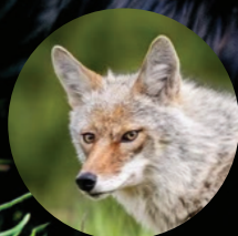
ODORAT EXCEPTIONNEL Coyote

Le nez de notre castor est un autre outil extraordinaire. Les castors utilisent leur incroyable odorat pour communiquer et marquer leur territoire dans les cours d'eau urbains à l'aide d'une forte odeur d'orange appelée castoréum. C'est comme un « parfum » qui leur permet de repérer leurs voisins , un peu comme une clôture qui sent bon! Son nez l'aide également à trouver des plantes savoureuses et à se protéger des prédateurs tels que les renards et les coyotes.