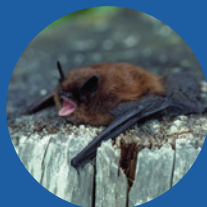
EXCELLENTE OUÏE Petite chauve-souris brune

Maintenant, entourez les sons que vous aimeriez moins entendre, ou ceux qui, selon vous, pourraient déranger un castor.