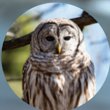
EXCELLENTE VISION Chouette rayée