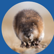
OUÏE MOINS DÉVELOPPÉE Rat musqué