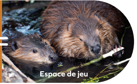
Espace de jeu