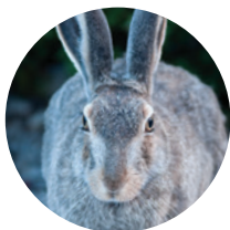
GOÛT DÉVELOPPÉ Lièvre

Trouvez une plante à fleurs et observez-la pendant cinq minutes. Comptez le nombre de pollinisateurs qui la visitent (abeilles, papillons, coléoptères ou colibris, par exemple) et notez ce que vous voyez. Notez les espèces les plus fréquentes et la manière dont elles interagissent avec la fleur.