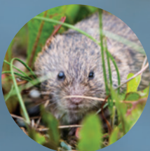
VISION PLUS FAIBLE Campagnol des prés