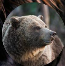
L'ANIMAL QUI PUE Grizzli

Trouvez deux choses à sentir autour de vous, comme un arbre, une fleur, de l'herbe ou de la terre. Décrivez l'odeur (terreuse, sucrée, fraîche) et remarquez d'où vient le vent.